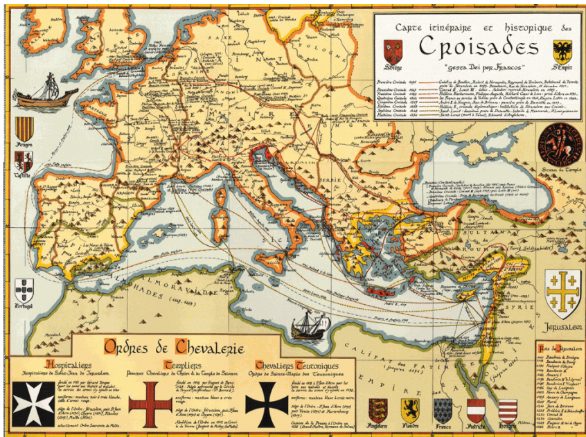
De Kruistochten tussen 1095 en 1271

Mensen uit alle sociale klassen uit heel Europa gingen op bedevaart langs dorpen, steden, kloosters en heiligdommen, over zee en over land.