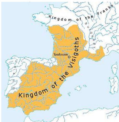
Rijk der Visigoten in 500 A.D.

De oorspronkelijke bewoners van het Iberisch schiereiland waren uiteraard geen christenen. In hun tijd bestond het christendom nog niet. Toen de Romeinse keizer Constantijn de Grote in het begin van de 4e eeuw het christendom tot godsdienst van het gehele Romeinse rijk verhief, gold dat ook voor de Romeinse provincie Hispania. Na de val van het Romeinse rijk werd het huidige Spanje onderdeel van het Visigotische rijk (418 - 721). De Goten kwamen oorspronkelijk uit het huidige Zweden; Gotenburg is naar hen genoemd. Rond 270 splitsten de Goten zich in Oostgoten, Ostrogoten en Westgoten, Visigoten. Na omzwervingen door oost-Europa en achtervolgd door de Hunnen werden eerst de Visigoten en later de Ostrogoten in het Romeinse rijk opgenomen. Aanvankelijk dienden de Visigoten als huurling in de Romeinse legioenen, bijv. in het in Spanje gelegerde Legio VI Victrix.