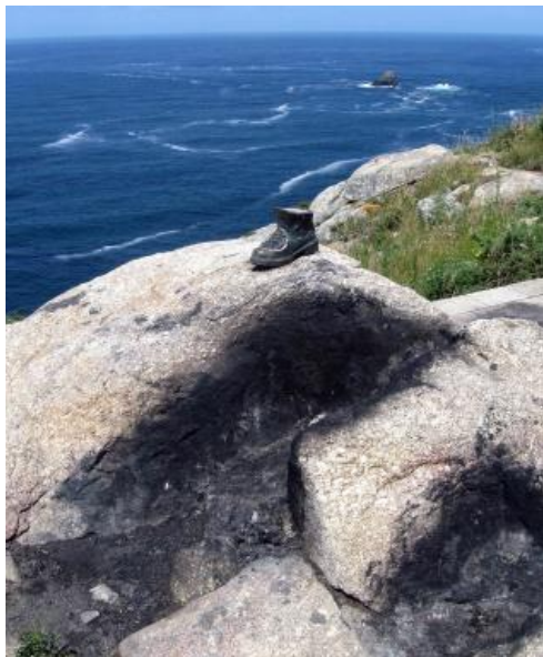
Schoen bij stookplaats op Fisterra

Voor sommigen nog steeds het echte einde van de pelgrimstocht. Op deze rotsige plek wierp de pelgrim zijn wandelstok in zee en verbrandde hij zijn kleren en schoenen. Ook nu nog voeren sommige pelgrims dit ritueel uit.