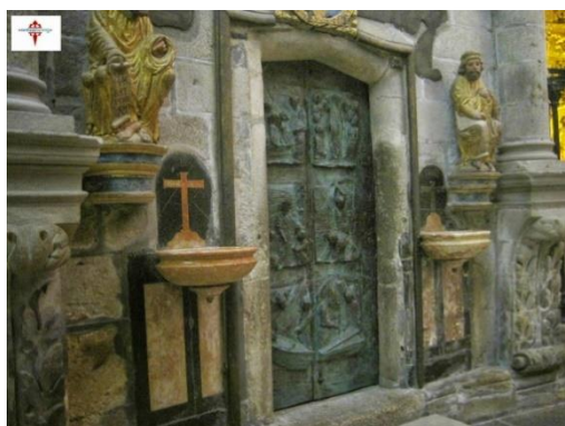
Heilige Deur van de kathedraal in Santiago

Over het jaartal 1428 verschillen de meningen, zie hoofdstuk 8.