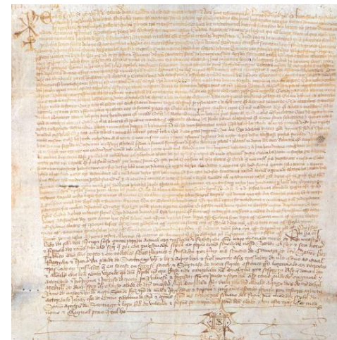
Concordia de Antealtares

Het grote tijdsverschil (813 versus 1077) geeft aanleiding tot scepsis.