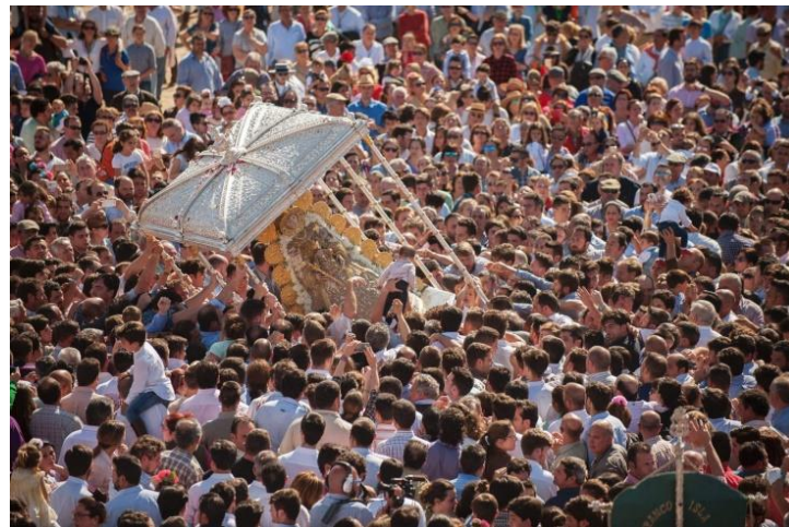
El Rocío, nabij Sévilla, verering van de maagd van el Rocío in 2016

Drukke huidige bedevaartsoorden zijn Lourdes, Fátima, el Rocío, Montserrat en –dichterbij– Kevelaer.