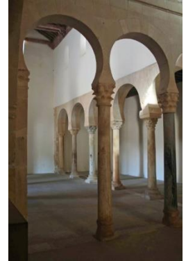
San Miguel de Escalada

De monniken brachten Moorse bouwstijlen mee. Deze mengeling van de Moorse met de traditionele bouwstijl heet de mozarabische kunststijl. Kenmerkend zijn de ranke pilaren en hoefijzervormige bogen. Ook te zien in de Mezquita (moskee) van Córdoba, die na de herovering van Córdoba in 1236 deels werd omgebouwd tot kathedraal.