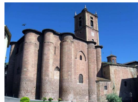
Nájera, klooster Santa María la Real

In de 11 e eeuw worden de steden Estella, Ponferrada, Santo Domingo de la Calzada en Logroño herbevolkt. Het aantal kloosters in deze regio groeide ook. Het zijn pleisterplaatsen dankzij de augustijner monniken in de Pyreneeën en de monniken van Cluny langs de rest van de route. Castiliaanse belangen vallen samen met die van de benedictijner Orde van Cluny, in 909 opgericht in Bourgondië. In 931 geeft paus Johannes XI deze orde opdracht de regels van Benedictus van Nursia (m.n. gehoorzaamheid, armoede en nederigheid) te implementeren in Europese kloosters. De naleving ervan was in de loop der eeuwen ernstig verwaterd. Dit leidde op Castiliaans grondgebied tot 25 kloosters die op Cluny georiënteerd waren. Zoals het monasterio Santa María la Real van Nájera, San Zoilo van Carrión de los Condes, San Juan de Ortega en San Millán de la Cogolla. Dank zij hun landerijen en het vele economisch erfgoed dat ze beheerden konden deze kloosters geestelijke ondersteuning en ook relatief goede materiële hulp bieden aan de vele pelgrims. Genoemde kloosters zijn ook nu nog te bezoeken.