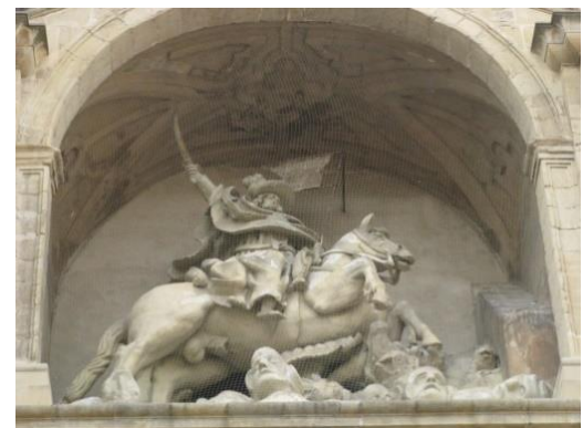
Santiago matamoros op de Iglesia de Santiago el Real in Logroño