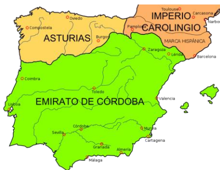
Situatie in de 9 e eeuw: Burgos is grensstad

Na de herovering van gebieden ten zuiden het Cantabrisch gebergte ontstond rond 814 een grens tussen het christelijke koninkrijk Asturië (Castilië en León bestonden nog niet) en het islamitische emiraat van Córdoba.