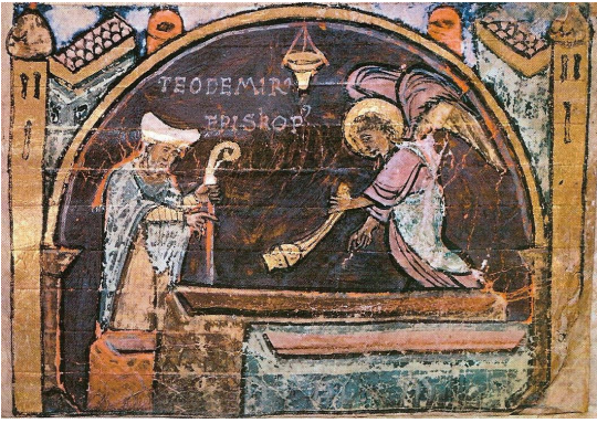
Bisschop Teodomiro bij het graf van Sint Jacob

Tijdens het koningschap van Alfonso II ontdekte herder/kluizenaar Pelayo (Paio of Pelagio) rond 813 een stenen graf. In dit graf wordt een onthoofd lichaam gevonden. Het hoofd ligt in de handen van het lijk. Teodomiro, bisschop van het diocees Iria Flavia, verklaart dat de gevonden beenderen toebehoorden aan apostel Jacobus de Meerdere, San (t)Iago el Mayor, de zoon van Zebedeus.