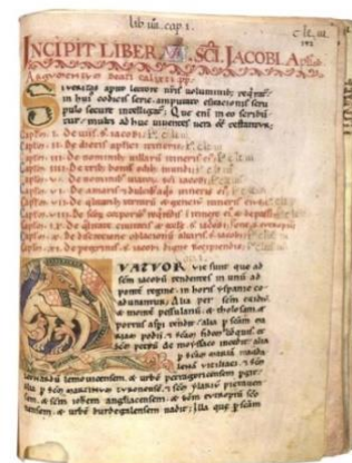
Het Liber Peregrinationis

De Codex Calixtinus, ook Liber Sancti Jacobi genoemd, is een verzameling van anonieme teksten in vijf boeken gemaakt in de 12 e eeuw. Het wordt zo genoemd omdat de teksten door de monniken van Cluny zijn toegeschreven aan paus Calixtus II. Zijn echte naam is Guido van Bourgondië. Hij was paus van 1119 tot 1124 en broer van Raymond van Bourgondië, die van 1091 tot 1107 heerser over Galicië was. Aimery/Aymeric Picaud, een Franse monnik, schreef het vijfde deel van de Codex Calixtinus, het Liber Peregrinationis. Maar het is bijna zeker dat hij alle teksten van deze Codex verzamelde en ordende. In het Liber Peregrinationis (het pelgrimsboek) staat een overzicht van de Camino Francés in dertien etappes. Picaud beschrijft de vier Franse aanvoerroutes van deze camino en de afstanden tussen dorpen en steden. Ook vermeldt hij bezienswaardigheden, betrouwbare oversteekplaatsen van rivieren, ziekenhuizen en hij waarschuwt voor de gevaren die de pelgrim kunnen bedreigen. Kortom een volwaardige reisgids.