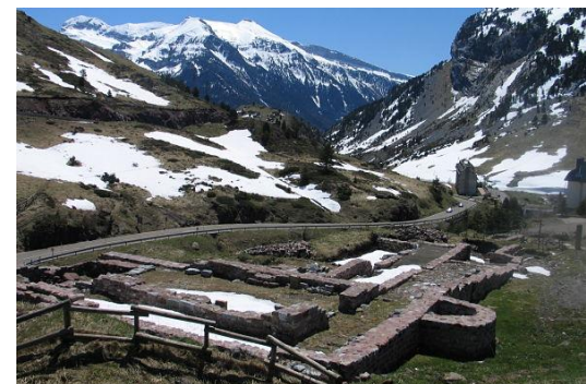
Fundamenten van het klooster Santa Cristina

Daardoor werd de col du Somport al snel de belangrijkste bergpas. Van dit klooster, nabij Candanchú, resteren nu slechts de fundamenten. Hotel Santa Cristina ligt aan de pelgrimsroute die de N-330a volgt. U fietst er voor de deur langs indien u de col du Somport neemt.