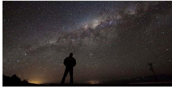
De Melkweg, een veld van sterren

Er is een theorie die stelt dat de camino oorspronkelijk een Keltisch ritueel is, dat door de Romeinen is overgenomen en weer later is gekerstend. In de vorm zoals hiervoor beschreven. In deze zienswijze is ‘campus stellae’ –sterrenveld– een verwijzing naar de Melkweg. En daarmee naar een Keltisch en later Romeins ritueel. De Kelten vereerden de zonnegod Lugh. Ze noemden de Melkweg de keten van Lugh. De stad Lugo vlakbij Santiago is naar deze god genoemd. De Romeinen noemden de stad Lucus Augusti. Het is de enige stad ter wereld met een nog geheel complete twee kilometer lange Romeinse stadsmuur. De Romeinen spraken over de via Láctea; lac is Latijn voor melk. En inderdaad, wanneer je in een donkere nacht omhoog kijkt naar de Melkweg zie je een veld van sterren. Het ritueel hield in dat pelgrims onder het schijnsel van de Melkweg naar het einde der wereld liepen: het sterrenpad, de camino de las estrellas. Deze route naar Finis Terrae liep in dezelfde richting als de route naar het graf van de apostel. Deze plek, Finisterre –in het Galicisch Fisterra–, ligt 80 km westelijk van Santiago aan de Atlantische kust.