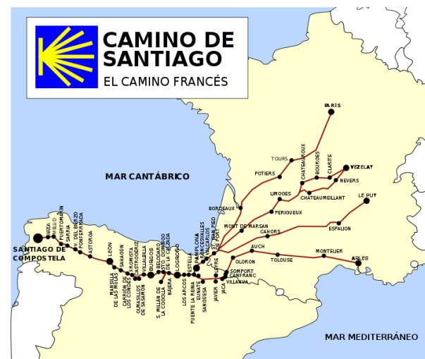
De vier Franse aanvoerroutes van de camino Francés

Hedendaagse Fransen beschouwen de camino die in le Puy-en-Velay begint als de belangrijkste Franse route richting Santiago de Compostela. De bedevaart startte er in 950 op initiatief van bisschop Godescalc.