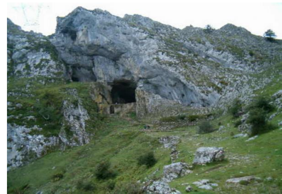
Túnel de San Adrián

Het gebruik van de tunnel de San Adrián verminderde in de 18 e eeuw toen een nieuwe weg was aangelegd via Salinas de Leniz.