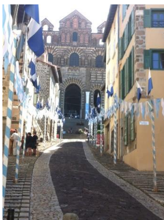
Kathedraal in le Puy-en-Velay

Naast het economisch belang van de bedevaart naar het graf van apostel Jacobus was het belangrijk de figuur Santiago matamoros levend te houden als motivator in de strijd met de islamitische Moren. Ten gevolge van deze strijd, de reconquista, was er in Noord-Spanje nóg een reden om de bedevaart te stimuleren. Er was behoefte aan herbevolking van het op de moslims veroverde gebied. De meeste Moren waren immers uit het gebied verdreven, verder naar het zuiden. Met name naar Andalusië. De vraag was: ‘waar halen we nieuwe –christelijke– bewoners vandaan?’ Met als antwoord: ‘vanuit het christelijke gebied ten noorden van de Pyreneeën.’ Mogelijk om deze reden stuurt koning Alfonso III (866-910) –merk op: niet een bisschop maar een koning– in 906 aan de bevolking van Tours een verzoek om te beginnen met bedevaarten naar het graf van Santiago vanuit gebieden van de over Pyreneeën. Een anonieme Duitse geestelijke in Tours begon in 930 en bisschop Godescalc van le Puy startte in 950 met het organiseren van de bedevaart.