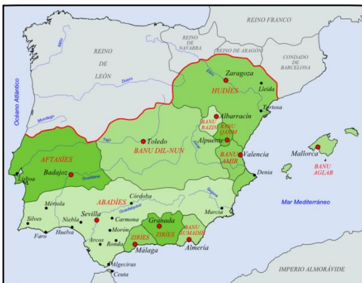
Situatie rond 1080: het kalifaat Córdoba is opgesplitst in taifa's

Het uiteenvallen van het kalifaat van Córdoba in 1031 in verschillende Arabische koninkrijkjes (taifa's), die elkaar ook onderling bevochten, is in het voordeel van de reconquista.