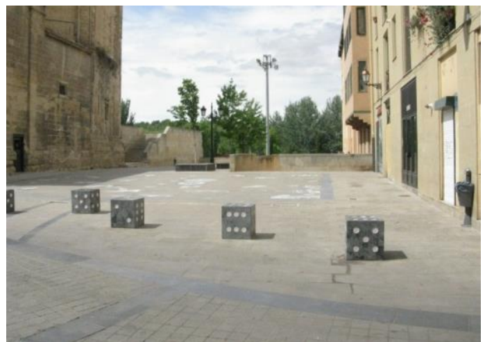
Camino-ganzenbord op een pleintje in Logroño

Een andere verwijzing naar de gans is in Logroño. Daar staat de kerk Iglesia de Santiago el Real aan een klein pleintje. In de gevel van deze kerk is een groot beeld van Santiago matamoros verwerkt. Op het pleintje is een ganzenbord compleet met dobbelstenen uitgebeeld. De vakjes van het ganzenbord zijn de plaatsen aan de camino. Vakje zes bijv. is Estella en nummer 63 is Santiago de Compostela.