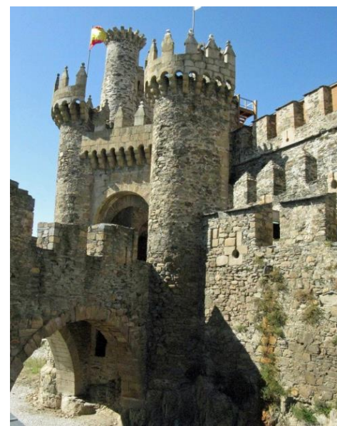
Ponferrada: burcht van de Tempeliers

Spaanse koningen gaven voordelen aan het netwerk van Cluny-kloosters aan en in de buurt van bedevaartroutes. Mede daardoor vestigden zich ook andere kloosterordes (bijv. Cisterciënzers) en militaire kloosterordes (zoals de Tempeliers), handelaren en ambachtslieden, in en rond de versterkte kerkgebouwen langs de camino. In Cañas, niet ver van de fietsroute, staat een klooster van de Cisterciënzers uit 1170. Het is zeker een bezoek waard. In alle belangrijke halteplaatsen werden ziekenhuizen gesticht: Jaca (1084), Pamplona (1087), Estella (1090), Nájera (1052), Burgos (1085), Frómista (1066), Carrión de los Condes, Sahagún, León (1096), Foncebadón (1103), Villafranca del Bierzo, O’Cebreiro, Portomarín en Santiago de Compostela. Aan het eind van de 11 e eeuw waren de risico’s van de bedevaart behoorlijk beperkt voor pelgrims die de Camino Francés namen. Het gastvrije netwerk van kloosters en ziekenhuizen werd een doeltreffend propagandamiddel, versterkt door de wonderen die werden toegeschreven aan apostel Jacobus.