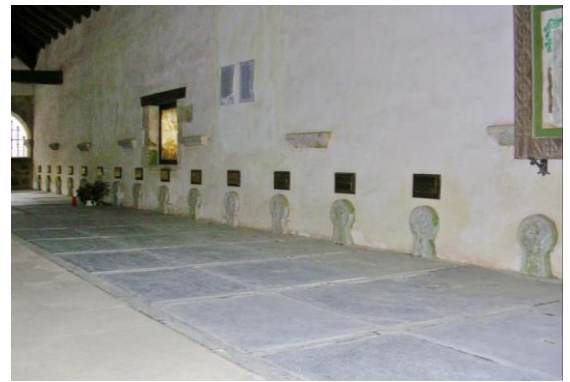
Pelgrimsgraven in Roncesvalles

Daarom wordt Aymeric Picaud gezien als eerste schrijver van moderne reisgidsen. Wanneer hij in 1127 de Ibañeta passeert vertelt hij over duizenden kruisen voor overleden pelgrims. Pelgrims hadden de gewoonte om daar, geknield naar het westen, aan de reis te beginnen. Het klooster in Roncesvalles was de eerste plaats van gebed in de reis naar Santiago de Compostela. In de Silo de Charlemagne (Karel de Grote) in Roncesvalles is nog een aantal pelgrimsgraven te zien.