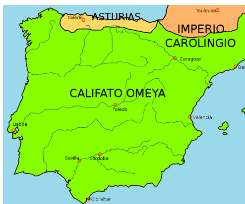
Het islamitische kalifaat Omeyya

Islamitische Moren, een verzameling Berbers uit Noord-Afrika en Arabieren uit het Midden-Oosten, veroveren tussen 711 en 718 onder leiding van Tariq ibn Ziyad (gouverneur van Tanger) het hele Iberisch schiereiland op de christelijke Visigoten, behalve Asturië.