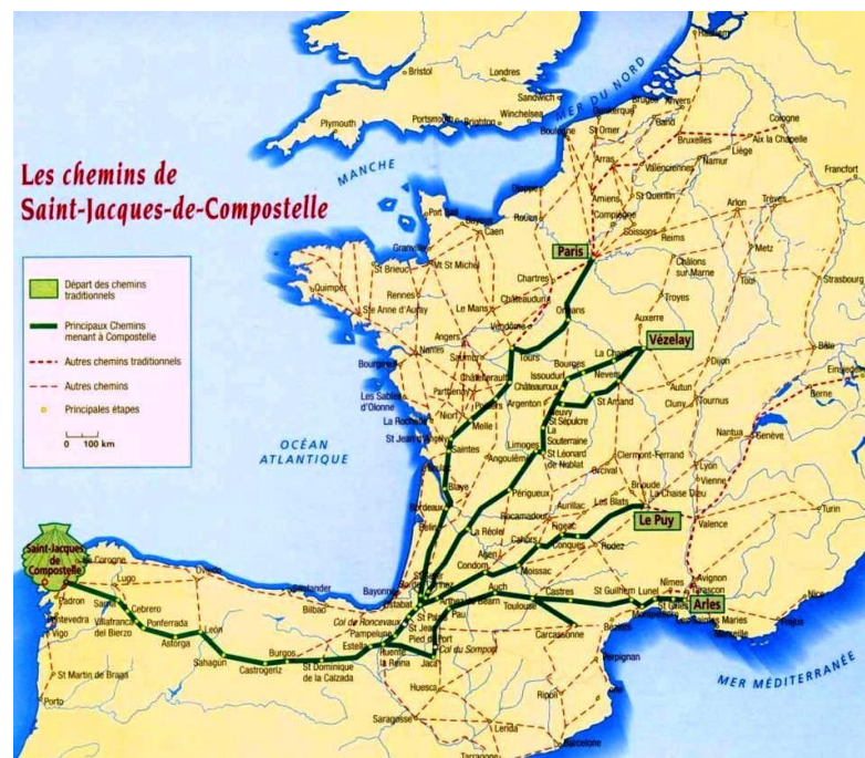
De belangrijkste pelgrimsroutes in Frankrijk

Bedevaarten werden voor velen een belangrijke reden om op reis te aan.