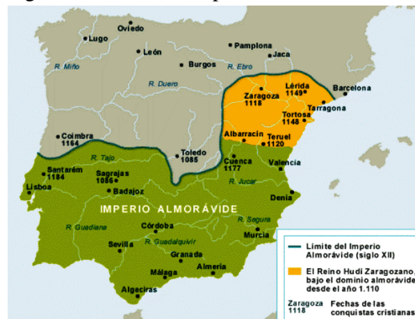
Spaanse reconquista: de stand in de 12 e eeuw

"Pelgrims en vreemden moeten veilig kunnen reizen, met name de pelgrims naar Santiago. Wij geven hen en al hun vrienden het voorrecht om naar onze koninkrijken te komen, er te blijven en weer te gaan, zonder hen te kwetsen of te schaden. Zonder hen gedwongen arbeid te laten verrichten of slecht te behandelen. En wij bieden de bedevaartgangers een veilig en gastvrij verblijf in onze herbergen. Zij kunnen vrij kopen wat ze willen. Niemand zal hen bedriegen door het veranderen van gewichten en regels. Degene die hen wel bedriegen zullen worden berecht. Pelgrims en buitenlanders kunnen vrij beschikken over hun eigendommen en niemand zal hen beroven. In geval van ziekte kunnen pelgrims en buitenlanders over hun eigendom beschikken via een testament. Zij worden niet opgesloten, levend noch dood. In geval hen schade wordt toegebracht zal de burgemeester zorgen voor compensatie. Als de pelgrim in juridische procedures tegen hoteliers, herbergiers of andere personen in het gelijk wordt gesteld zal de burgemeester hen de proceskosten tweemaal vergoeden.