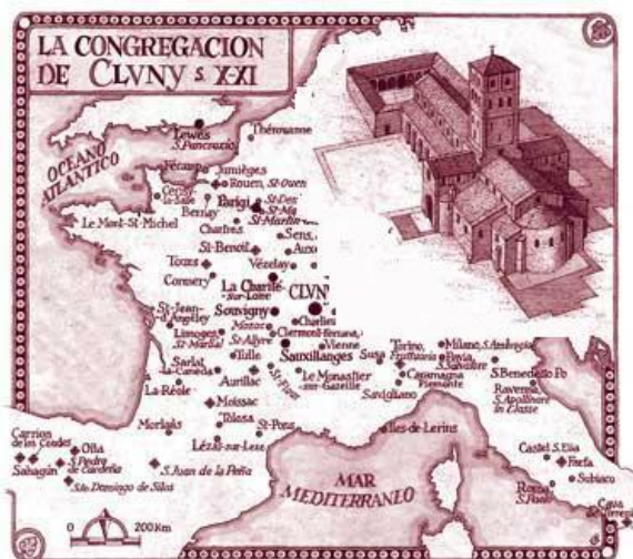
Kloosters van Cluny in west Europa

In de 12 e eeuw beleefde de bedevaart naar Santiago de Compostela haar hoogtijddagen, midden in een periode van groei en welvaart in Europa die duurde van de 11 e tot en met de 13 e eeuw.