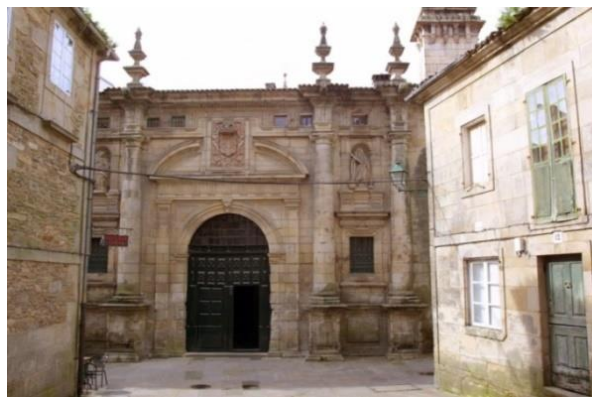
Monasterio San Pedro de Antealtares

De verklaring van Teodomiro dat het graf van apostel Jacobus was gevonden leidde tot een bedevaart. De meest verspreide theorie zegt dat Pelayo het graf vond in het bosgebied Libredón, in de buurt van de kapel in zijn woonplaats Solovio. In enkele opeenvolgende nachten had Pelayo een mysterieuze schittering, een meteorietenregen, gezien op een terp van het bos. De kerk San Fiz (San Félix) de Solovio, in de 10 e eeuw door bisschop Si(s)nando gebouwd op de plek van de kapel van Pelayo, is een van de oudste kerken in Santiago de Compostela. Zij staat aan het Praza de San Fiz de Solovio, vierhonderd meter van de kathedraal. De kapel werd in 997 verwoest door Almanzor en later als kerk herbouwd. In de 18 e eeuw werd zij gerestaureerd. In deze theorie is de naam Compostela afgeleid van 'campus stellae', Latijn voor sterrenveld, een verwijzing naar de vallende sterren die Pelayo naar het graf van Sint Jacob leidde.