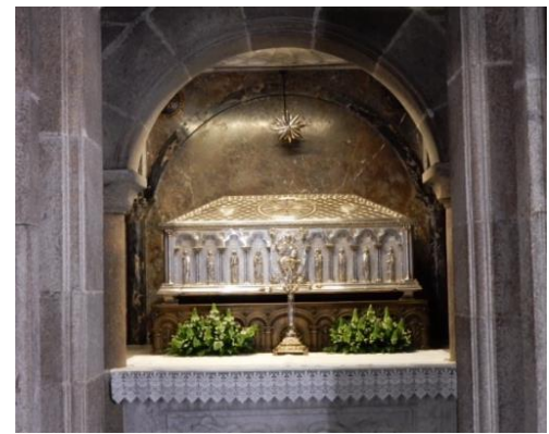
Schrijn met de relikwieën van apostel Jacobus

Deel 3 : Het verhaal van de overbrenging van het lichaam van de apostel naar Spanje. Twee leerlingen van Sint Jacob varen, geleid door een engel, via de zuilen van Hercules (Straat van Gibraltar) naar open zee. Ze stranden bij Iria Flavia. De steen waarop ze het lichaam leggen verandert in een sarcofaag. De naam Iria Flavia wijzigt na de vondst van de sarcofaag in Padrón, afgeleid van Petronus, een verwijzing naar deze steen.