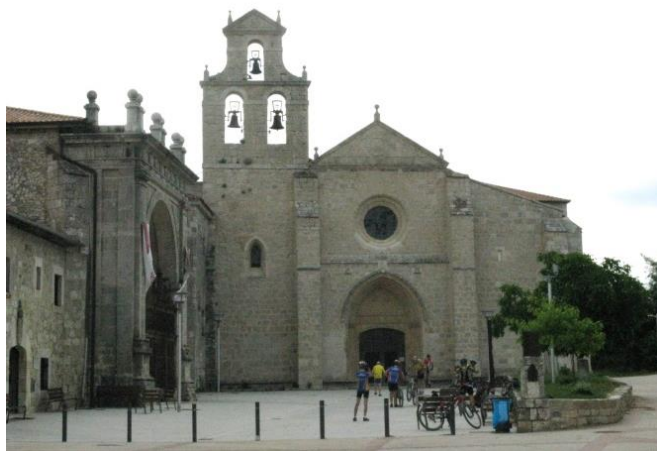
Monasterio van San Juan de Ortega

In de 11 e eeuw kwam een ware volksverhuizing op gang.