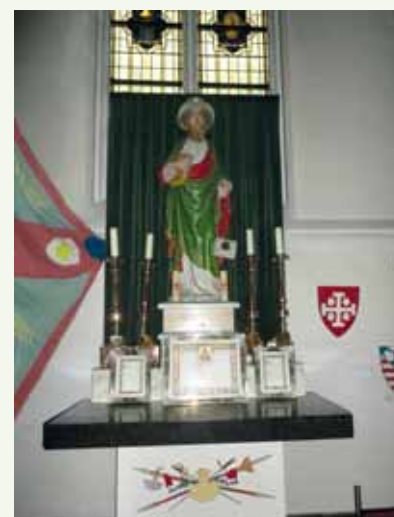
Sint-Jacobus, Jacobus de Meerderekerk, Zeeland.

De beschreven wandeling maakt deel uit van de etappe Zeeland – Den Bosch van de Jacobsweg Nieuwemeghen (Jacobswegen in Nederland, deel 2) .