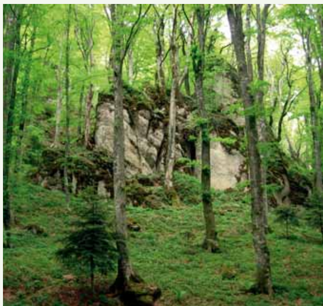
Geraakt door eenvoud en natuur: Cammino di Assisi