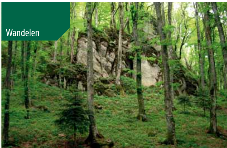
La Foresta Sacra.