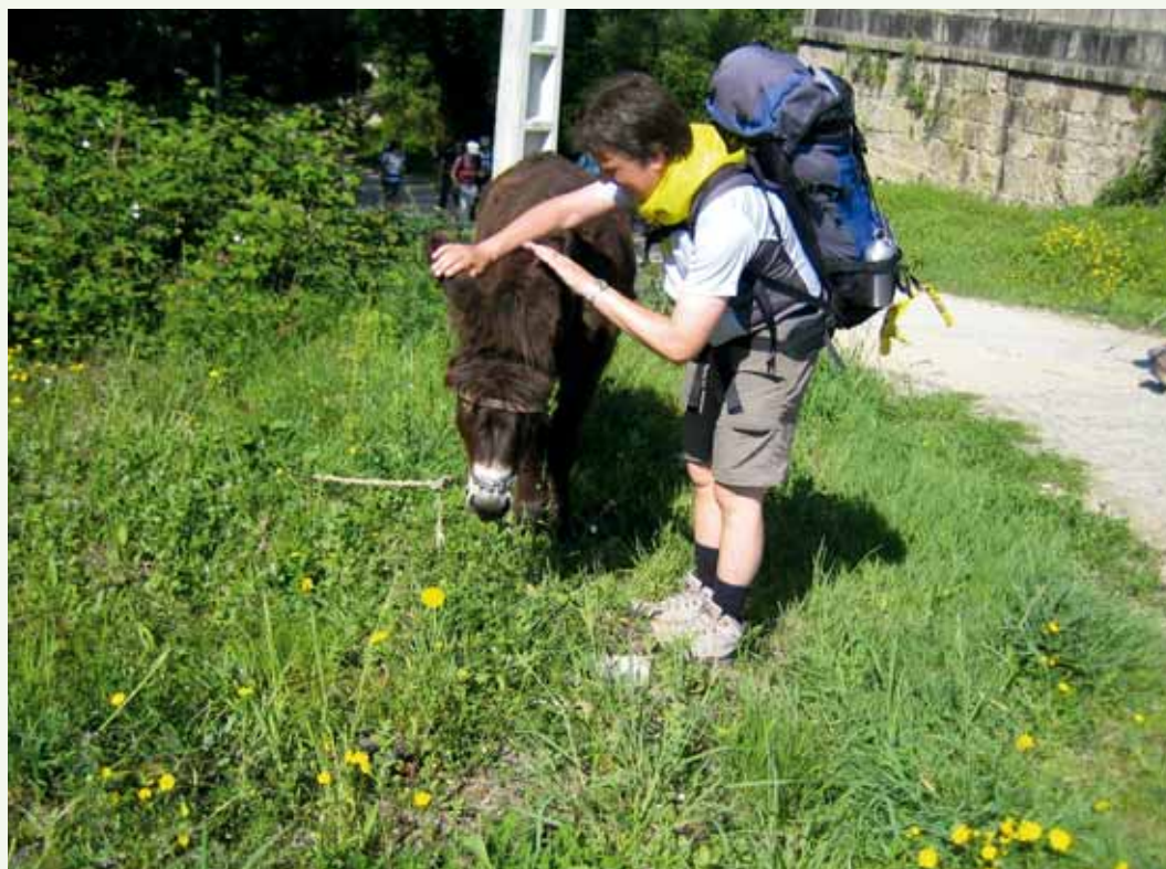
‘Ja Bert, dat zijn nu mijn oren.’

In Portugal zijn we twee vrouwelijke pel-