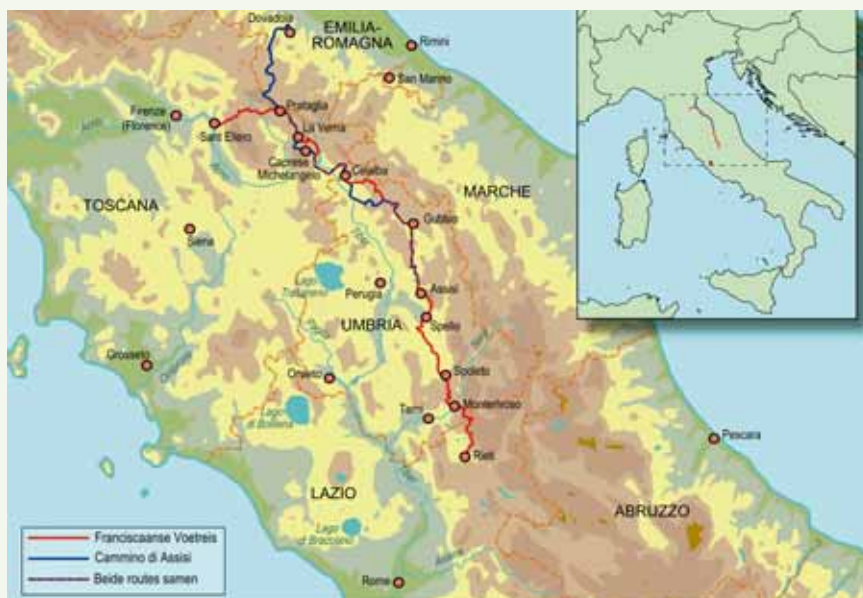
Kaart: Wobien Doyer, met medewerking van Han Lasance

De camino's in Spanje richten zich allemaal op het (vermeende) graf van Jacobus. Franciscus heeft veel meer sporen achtergelaten