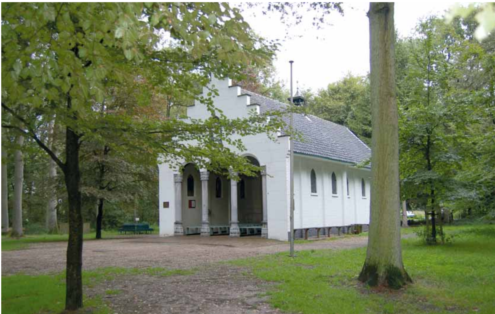
De Kapel van de Heilige Eik, Oirschot.