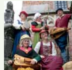
Wronghel en Wei

Eventuele vragen en reacties kunt u mailen naar regio.den-haag@santiago.nl . 🌿