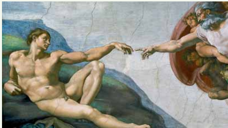
De schepping van Adam (c. 1511). Fresco van Michelangelo in de Sixtijnse Kapel, Vaticaanstad.

Zondag 27 mei, Pinksteren in Assisi. De geest daalt neer. We hebben overnacht aan de voet van het stadje, in een prachtig kloostertje dat overduidelijk door diezelfde geest is aangehaakt. Wij stijgen op, langs de steile heiligen van de Monte Subasio, ooit een geliefd toe-