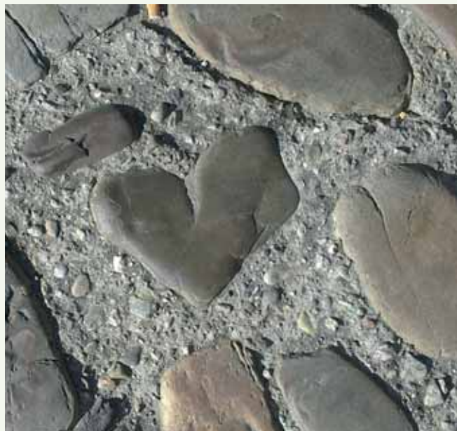
Stenen als symbool en ritueel